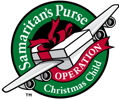
Full Color (Spot)

오퍼레이션 크리스마스 차일드의 승인된 로고는 다음과 같으며 이외의 수정 혹은 변경을 금지합니다. 로고는 등록 상표로써 기호와 함께 사용되어야 합니다.