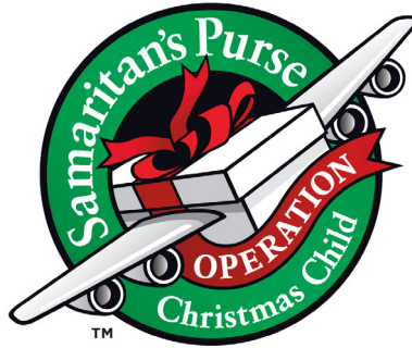
Full Color (4-Color Process)