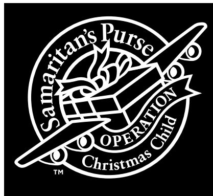
1-Color Reversed (White Only)