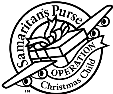
1-Color (Black Only)